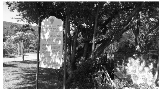
写真2 モナ領地② (大学が設置した遺跡の表示板)