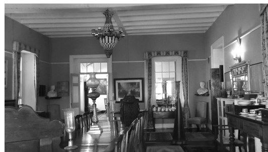
写真8 Greenwood Great House ① (室内 ダイニング・ルーム)