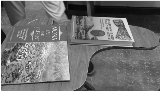
写真3 モナ領地③ (モナ領地についての書籍・パンフレット)