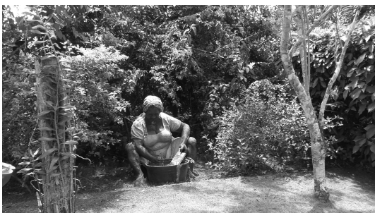
写真7 Good Hope 領地③ (洗濯する女奴隷像。 近年観光客向けに設置されたものか)