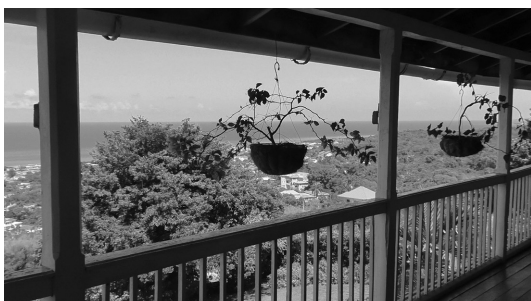
写真9 Greenwood Great House ② (バルコニーからカリブ海を望む)