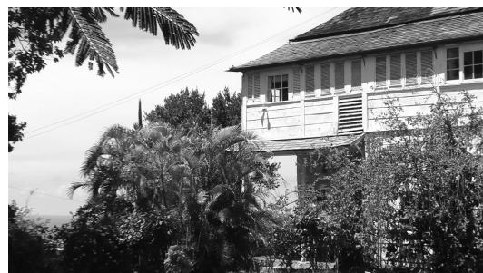
写真10 Greenwood Great House ③ (外観)