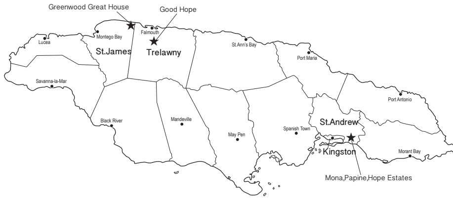
図2 調査対象の位置