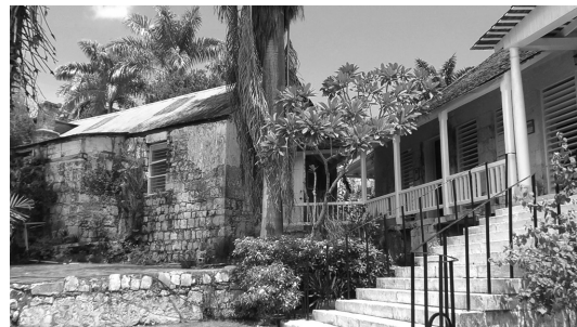
写真6 Good Hope 領地② (グレイト・ハウス裏)