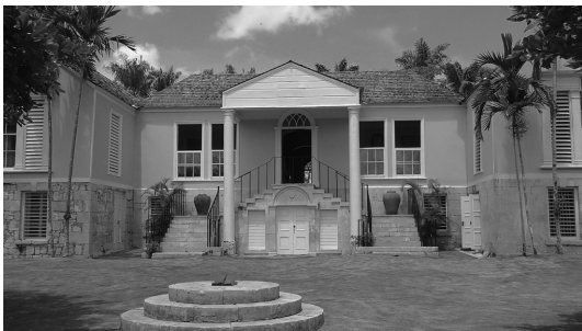
写真5 Good Hope 領地① (グレイト・ハウス正面)