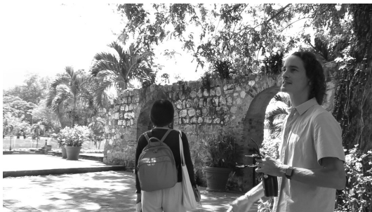
写真1 モナ領地① (砂糖耕作用の水道橋)