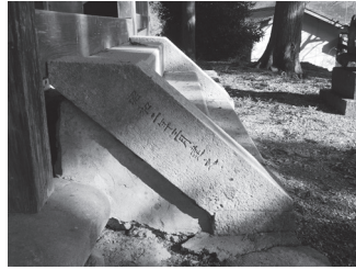
写真10 拝殿正面石階左側面銘文