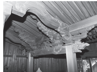
写真3 本殿庇見返し