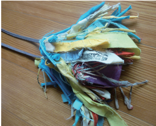
写真3 向井家のおひねり