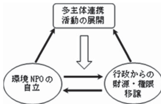
図2 ローカルガバナンス形成の3つのフェーズ

地域環境保全を担う組織の「自立」と「持続性」という課題がある。「びわこ豊穡の郷」は、NPO組織として活動を継続しているが、いくつかの課題を抱えている。通常のNPOとしての課題(ミッションの明確化と組織内/組織外コミュニケーションによる組織マネジメント能力の向上、会員およびリーダー層の人材確保、会費収入・行政からの定常的な委託収入などの財源確保)に加えて、必要とする資源(財源や人材など)を、基本的に地域社会に求めなければならないという課題である。