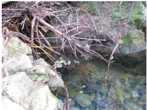
図2. 岩尾谷川における生息環境（左：岩尾谷川，右：生息場所の緩流部。京都市左京区大原小出石町，2011年9月26日撮影）