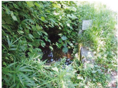
図5. 大津市における生息環境（左：生息場所横の林道，右：生息場所の水路，伊香立生津町，2011年7月16日撮影）

貴船川の一次支流（低水路の幅：約50 cm，水深：約10 cm）に存在する水たまり（周囲の長さ：約50 cm）で，底質は礫であった（図4）。