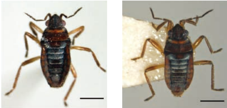
図1. チャイロケシカタビロアメンボの雌雄成虫（左：無翅型雌，京都市左京区鞍馬貴船町産。右：無翅型雄，京都市左京区大原小出石町産）。スケール：0.5 mm.