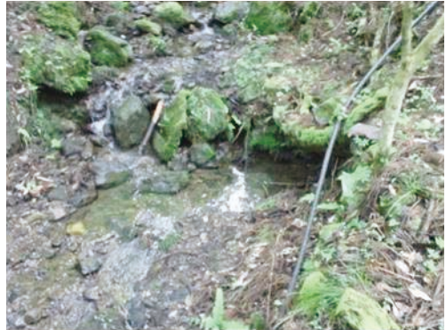
図4. 貴船川における生息環境（左：貴船川の一次支流，右：生息場所の水たまり，京都市左京区鞍馬貴船町，2011年5月23日撮影）