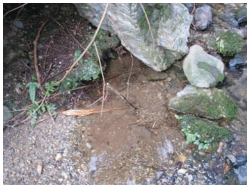
図3. 高谷川における生息環境（左：高谷川の一次支流，右：生息場所の水たまり。京都市左京区大原小出石町，2011年9月26日撮影）