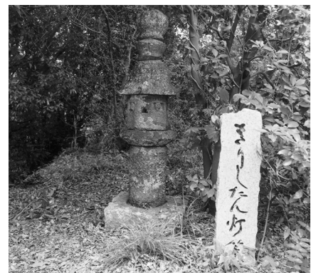
写真1 奥中山八角灯籠現況

この灯籠は蓮華寺から少し東方に離れた道路脇の削平地に設置されていた（105頁図1参照）。灯籠の